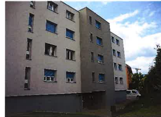
Rénovation Immeuble locatif à Gland en passant les tubes de pulsion du double flux en façade sans créer de pont thermique grâce à leur faible diamètre de 47mm