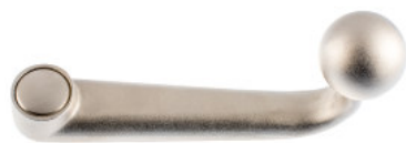
Poignée forme col de cygne zinc moulé nickelé mat