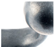
zinc moulé brut