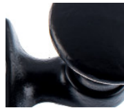
fonte vernise noire