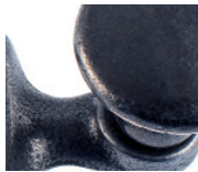
fonte noire antique