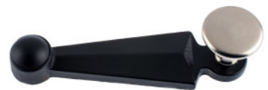
Poignée fonte vernise noire bouton plat laiton nickelé mat