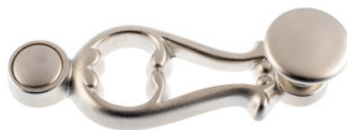
Poignée avec bouton plat laiton nickelé mat