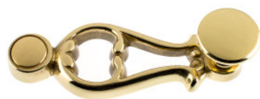
Poignée avec bouton plat laiton poli