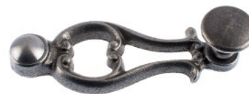
Poignée avec bouton plat fonte brut