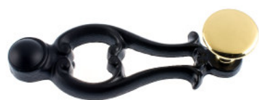
Poignée fonte vernée noire bouton plat laiton poli