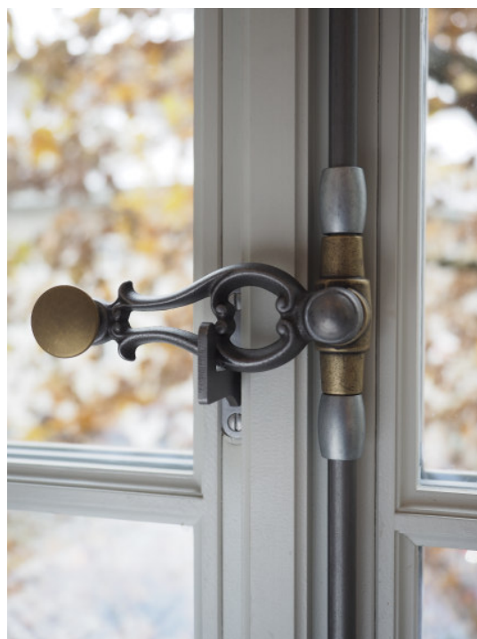
Poignée fonte brut avec bouton plat laiton brut