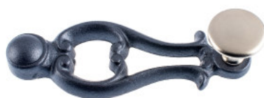
Poignée fonte vernée noire antique bouton plat laiton nickelé mat