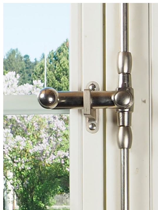
Poignée fonte avec bouton à boule laiton nickelé mat