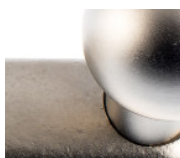
fonte nickelé mat