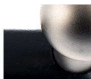
fonte vernée noire