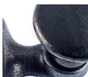
fonte noire antique