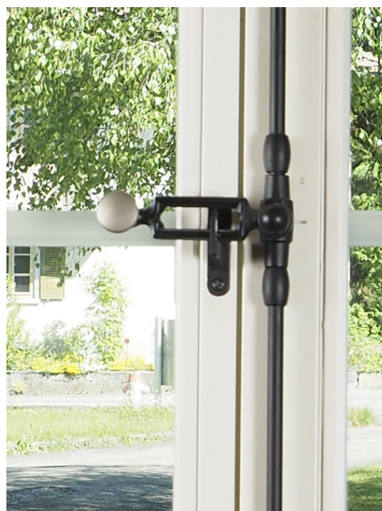
Poignée fonte vernée noire avec bouton plat laiton nickelé mat