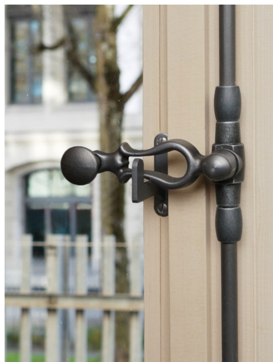
Poignée fonte brut avec bouton plat en patine gris-fonte