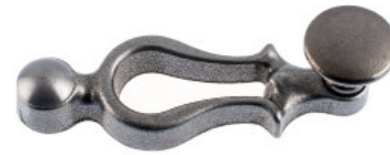
Poignée avec bouton plat fonte brut