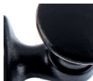
fonte vernée noire