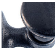
fonte noire antique