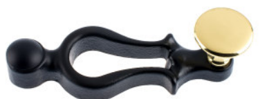
Poignée fonte vernée noire bouton plat laiton poli