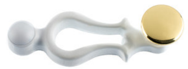
Poignée fonte vernée blanche bouton plat laiton poli