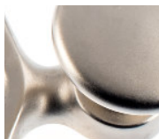
laiton nickelé mat