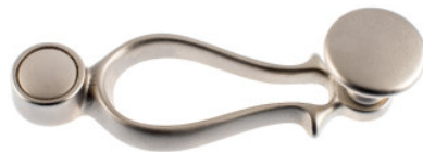
Poignée avec bouton plat laiton nickelé mat