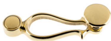
Poignée avec bouton plat laiton poli